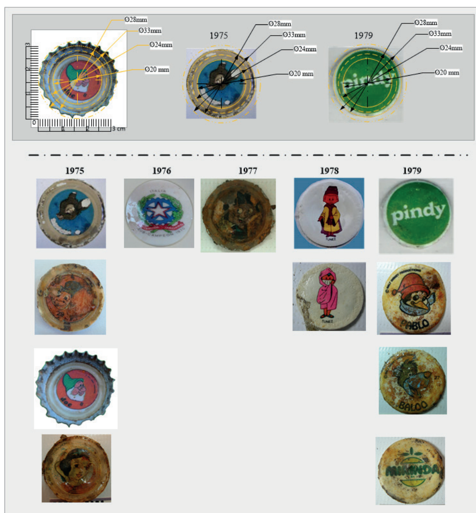
Figura 4. Ejemplos de “gomitas” recuperadas en el interior del Pozo de Vargas.

A partir de lo expuesto anteriormente es posible sostener –teniendo en cuenta las identificaciones y aspectos tanto estratigráficos y microestratigráficos que derivan del análisis de los procesos de formación de los depósitos arqueológicos (cf. Leiva, 2016; Ataliva et al., 2021)– que las “gomitas” están jalonando el período 1975-1979 (de hecho, todas corresponden a este período, destacándose la ausencia de hiatos, Figura 4). Del universo de materiales sintéticos