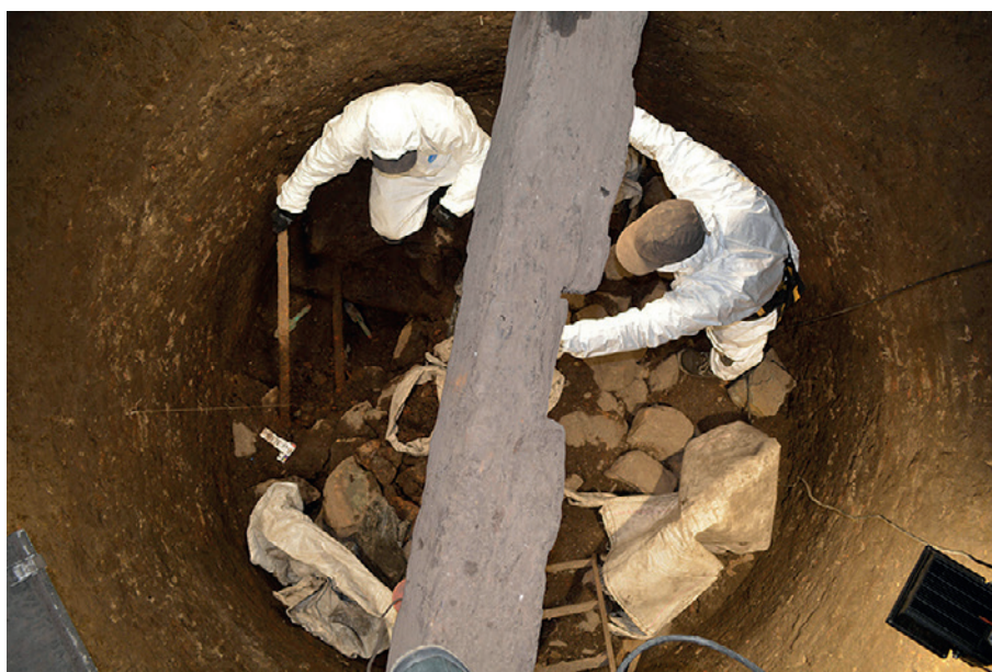
Figura 2. Interior del Pozo de Vargas a los 26 metros de profundidad.

Entre las fuentes orales que permiten complementar/confrontar los resultados de los análisis arqueológicos y las experiencias de